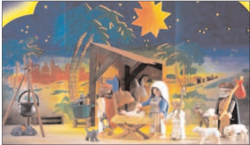
Une crèche Playmobil?

Journal web bimensuel qui vise à faire connaître des parcours et des lieux où se vivent des expériences humaines et spirituelles novatrices.