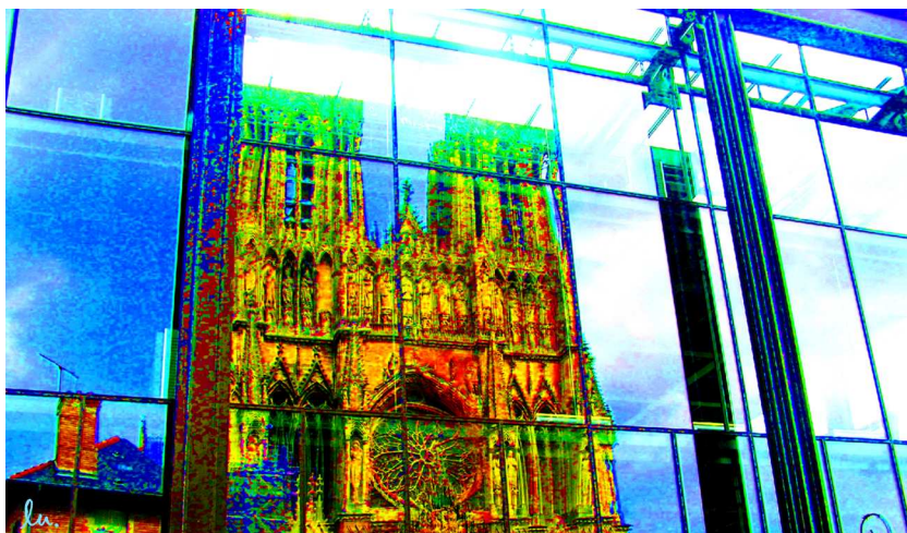
© Lucie Brousseau, 2007. D'après une photo de D. Laliberté.

Journal Web bimensuel qui vise à faire connaître des parcours et des lieux où se vivent des expériences humaines et spirituelles novatrices.