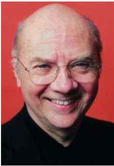
Mgr Jacques Gaillot, évêque des pauvres

On lui a attribué plusieurs noms : le cyberévêque, l'évêque des exclus, l'évêque des sables... De tous ces titres, Jacques Gaillot dit préférer « évêque des pauvres ». « Si c'est vrai, c'est très bien... » ajoute-t-il avec hésitation. Pour celui qui vit aujourd'hui avec les sans-papier, les sans-domicile et les sans-reconnaissance, la solidarité envers les plus mal pris n'est pas qu'une exigence morale, c'est le lieu de la révélation : « [Dieu] nous précède là où des hommes et des femmes sont en danger. C'est là qu'il faut aller en priorité. Jésus a dit : j'ai été envoyé annoncer la Bonne Nouvelle aux pauvres. Pas aux riches, pas à tout le monde, il dit aux pauvres. Bon, c'est le choix de Dieu! Il commence par là. » Et c'est là que commencent les journées de Jacques Gaillot depuis qu'on lui a retiré la charge épiscopale du diocèse d'Évreux, en France, en raison de ses prises de positions dérangeantes.